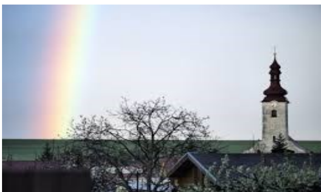
Kostol svätej Kataríny Alexandrijskej (farský kostol)