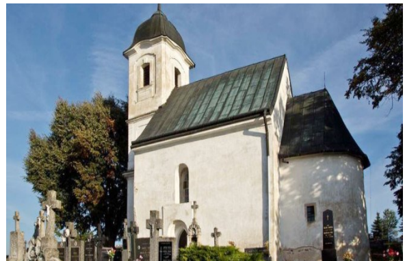
Kostol Všetkých svätých „Rotunda“