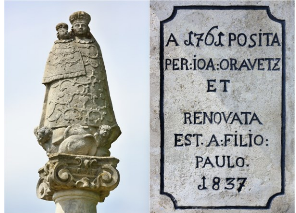
Socha na stĺpe Panna Mária s dieťaťom