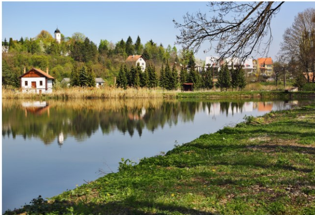
Sústava dechtických rybníkov