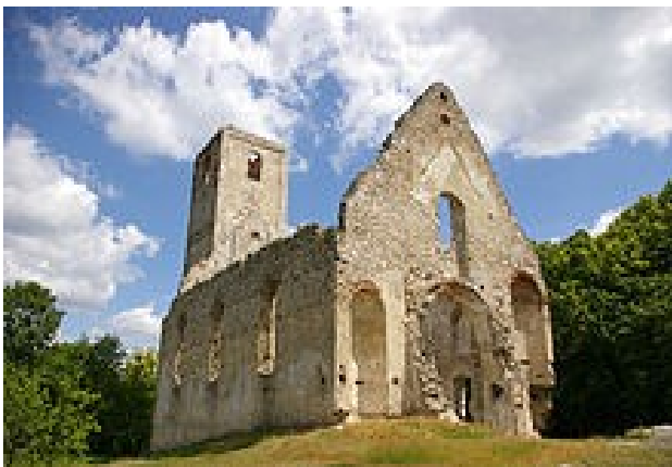
Zrúcaniny kostola svätej Kataríny „Katarínka“