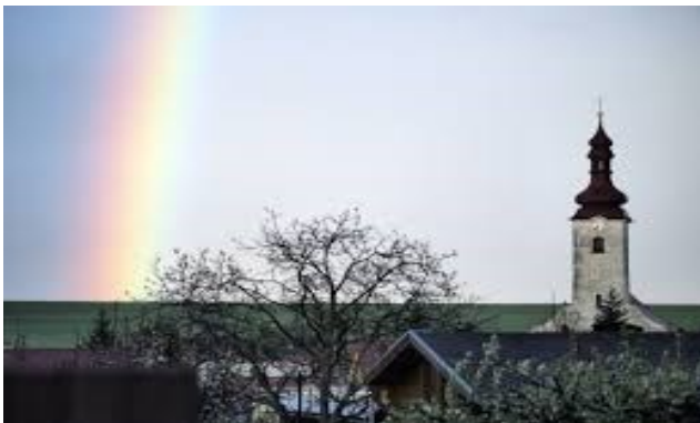
Kostol svätej Kataríny Alexandrijskej (farský kostol)