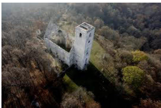
Zrúcaniny Kostola svätej Kataríny (pohľad zhora)