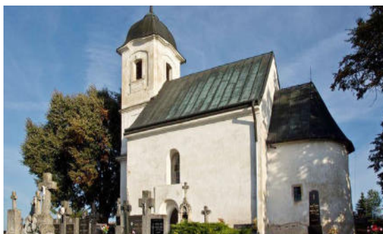
Kostol všetkých svätých Dechtice „Rotunda“