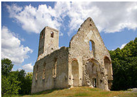
Zrúcaniny Kostola svätej Kataríny „Katarínka“