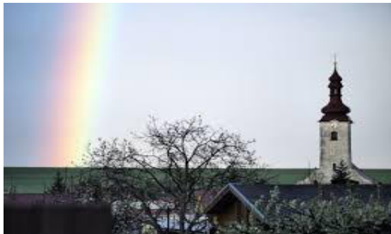
Kostol svätej Kataríny Alexandrijskej (farský kostol)

V obci sa nachádza Rímsko-katolícky kostol svätej Kataríny Alexandrijskej z roku 1652 a na cintoríne Románsky kostol Všetkých svätých datovaný do roku 1172, ktorý patrí medzi národné kultúrne pamiatky. V centre obce je kaplnka z roku 1743 zasvätená Panne Márii Karmelskej. V katastrálnom území Obce Dechtice sa nachádzajú ruiny kláštora a kostola svätej Kataríny Alexandrijskej z roku 1618. V roku 1771 bola v obci postavená papiereň, ktorá však v roku 1885 vyhorela. V obci sa taktiež nachádza Rybáreň – sústava rybníkov s liahňou a Mudrochov mlyn.