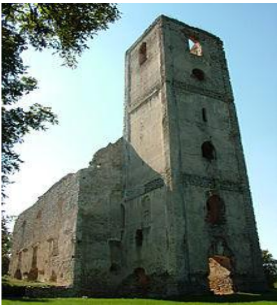
Zručaniny Kostola svätej Kataríny (čelný pohľad)