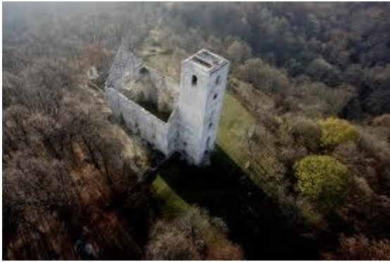
Zručaniny Kostola svätej Kataríny (pohľad zhora)