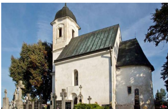
Kostol všetkých svätých Dechtice „Rotunda“