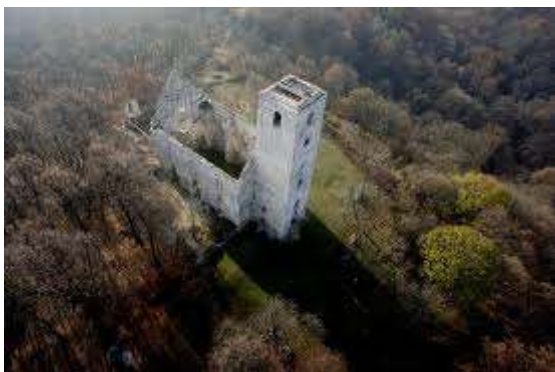
Zručaniny Kostola svätej Kataríny (pohľad zhora)