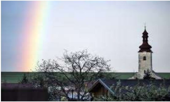
Kostol svätej Kataríny Alexandrijskej (farský kostol)

V centre obce, na mohyle navýšenej neďaleko kostola nazývanej Vysoké hradišče, je kaplnka z roku 1743 zasvätená Panne Márii Karmelskej. V roku 1771 bola v obci postavená papiereň, ktorá pracovala do roku 1885, kedy vyhorela. Neďaleko obce, v romantickom lesnom prostredí, bol v roku 1775 postavený lovecký zámoček Planinka.