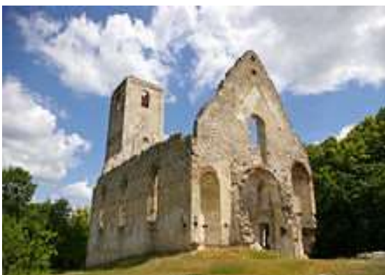
Zrúcaniny Kostola svätej Kataríny „Katarínka“