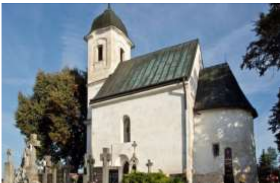
Kostol všetkých svätých Dechtice „Rotunda“