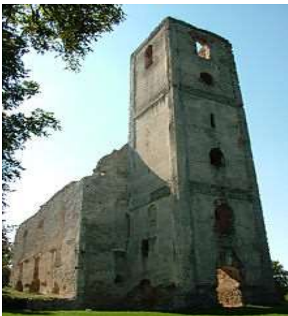
Zručaniny Kostola svätej Kataríny (čelný pohľad)