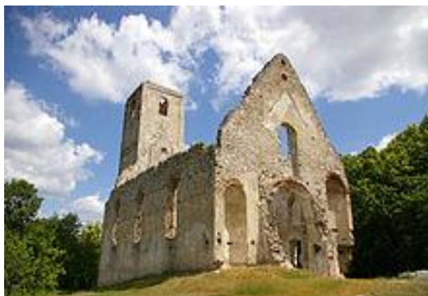
Zrúcaniny Kostola svätej Kataríny „Katarínka“