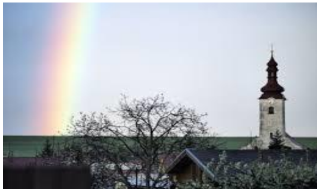
Kostol svätej Kataríny Alexandrijskej (farský kostol)

ktorá pracovala do roku 1885, kedy vyhorela. Neďaleko obce, v romantickom lesnom prostredí, bol v roku 1775 postavený lovecký zámček Planinka.