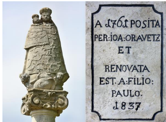
Socha na stĺpe Panna Mária s dieťaťom