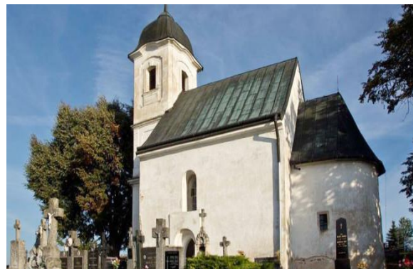
Kostol Všetkých svätých Dechtice „Rotunda“