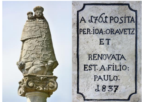
Socha na stĺpe Panna Mária s dieťaťom