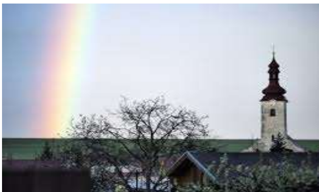
Kostol svätej Kataríny Alexandrijskej (farský kostol)