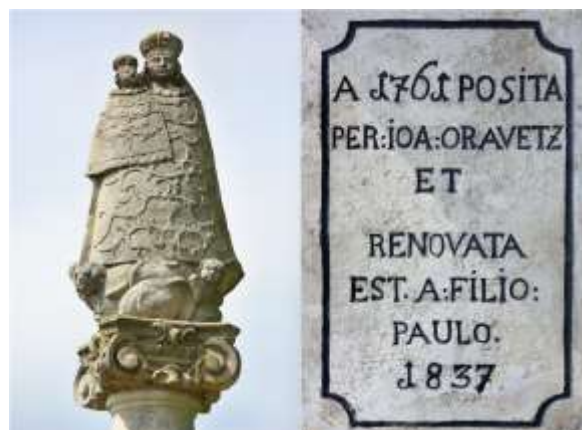
Socha na stĺpe Panna Mária s dieťaťom