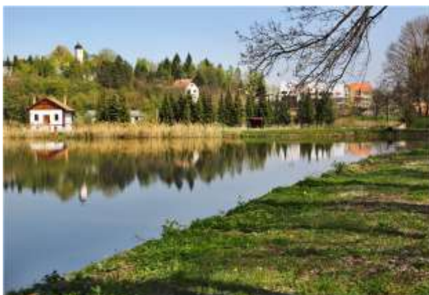
Sústava dehtických rybníkov