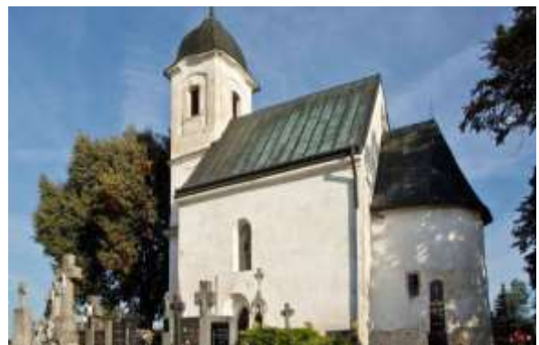
Kostol Všetkých svätých Dechtice „Rotunda“